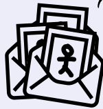
les enveloppes à dessins + feuilles à dessiner