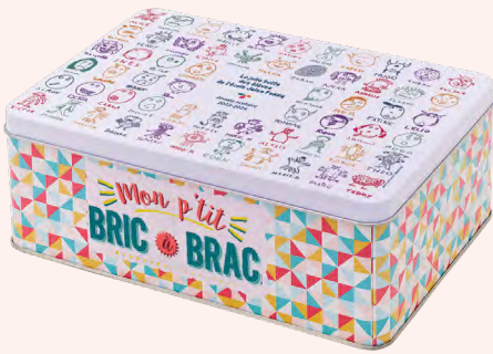
BRIC À BRAC